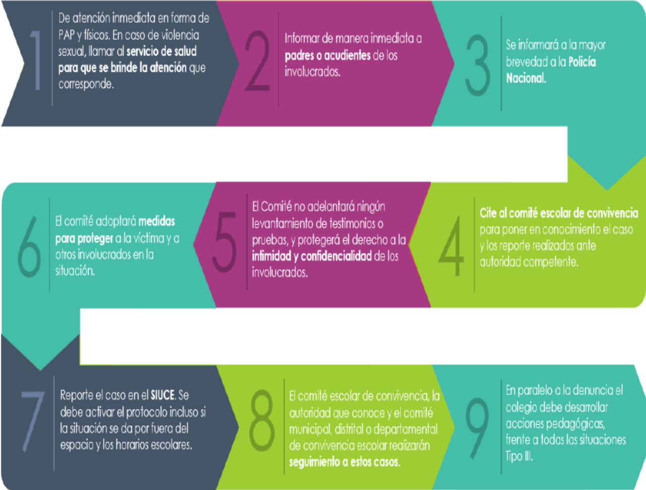
Esquema de atención de Situaciones Tipo III